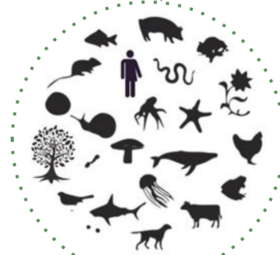
Eco System "It's About Us"